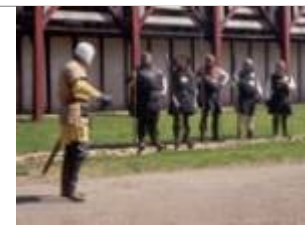
Ferme médiévale de Clairebois à côté de Sainte-Suzanne.