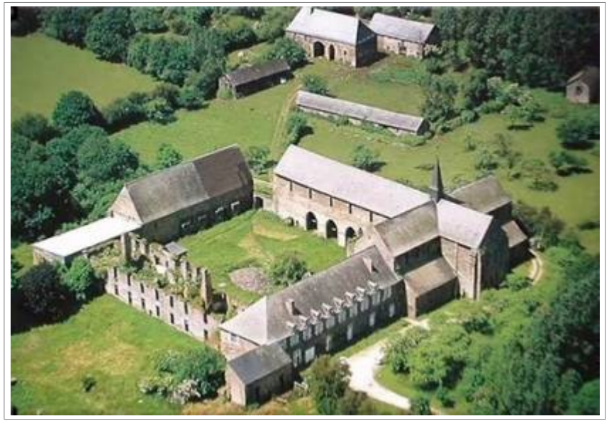
Abbaye de Clermont

Dénivelé - 845 m Altitude Maxi 196 m - Altitude Mini 49 m