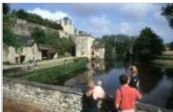
Moulin de Thévalles